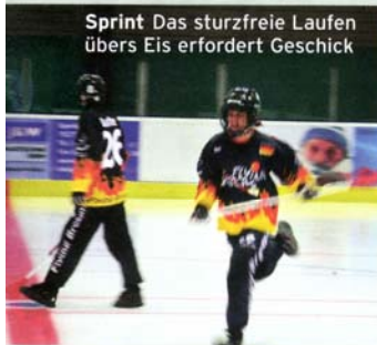
Sprint Das sturzfreie Laufen übers Eis erfordert Geschick

Leicht zu erlernen und obendrein ein klasse Ganzkörper-Workout: Broomball boomt!